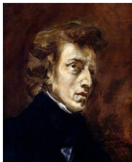
г) И. Стравинский